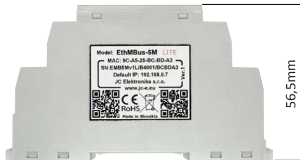
Pohľad z boku